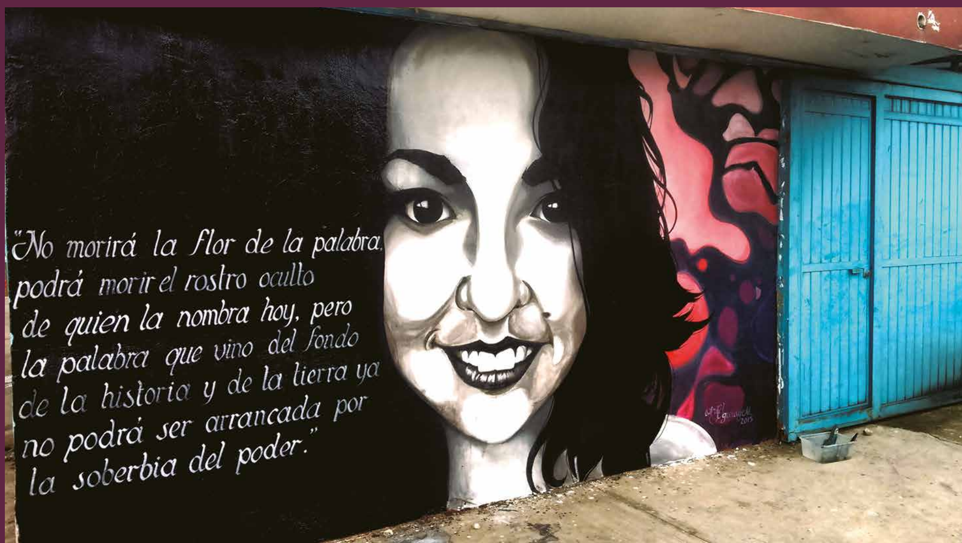
Mural en honor a Nadia Vera, la activista asesinada en la colonia Narvarte, por su activismo en Veracruz, junto con el fotoperiodista Rubén Espinosa y otras tres mujeres. El mural fue elaborado por Ariel E. Segura y Medina, quien la conoció, en una escuela pública de Jalapa, Veracruz. En nuestro Facebook: POS MAS, podrás leer una carta que el joven pintor nos hizo llegar.

El movimiento se encamina en luchar por la dirección del sindicato, en las elecciones que están próximas. REDIME es la única planilla dentro del SMSEM que es oposición a la política sindical actual. Con un proyecto sindical, resultado de diversas organizaciones magisteriales que se han unido al calor de la lucha, su propuesta gira en torno a cuatro ejes: en materia económico social, gremial, educativo y de identidad. Dos de sus puntos centrales son la defensa de la educación pública y la democratización del sindicato. A primera vista, se ve alentador el crecimiento de REDIME y la posibilidad del triunfo de éste para la secretaría general. Sin embargo, es necesario tener en cuenta los escenarios adversos y la lógica de la lucha. Si el movimiento no obtuviera la secretaría general, el proceso debe continuar como una corriente sindical permanente dentro del sindicato, que le permita hacer constante entre las bases magisteriales, reorganizando la lucha contra la reforma educativa y acrecentar la unidad con los docentes disidentes federales, de forma más coordinada.