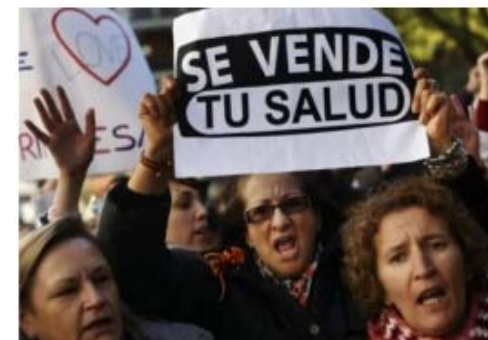
FOTO: LA LUCHA EN ESPAÑA CONTRA LAS CONSECUENCIAS DEL PACTO DE TOLEDO QUE AUMENTÓ LA EDAD DE JUBILACIÓN Y LOS AÑOS DE COTIZACIÓN

CONFERENCIA DICTADA EL 26 DE JUNIO EN EL SALÓN DE PROFESORES DE LA FACULTAD DE HUMANIDADES