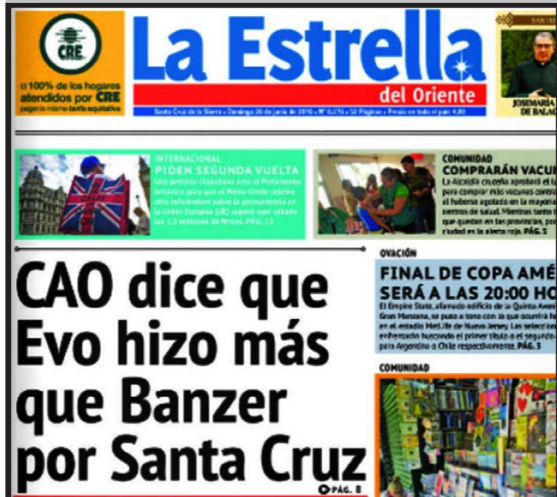
Tapa y página interior del periódico cruceño La Estrella del Oriente del 26 de junio del presente año