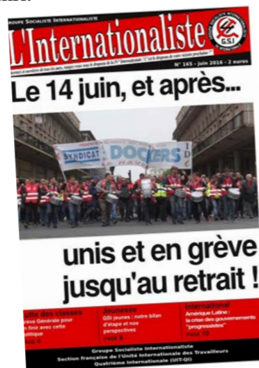
Periódico sección francesa de la UIT-CI

huelgas pasando por encima de las conducciones obreras. En el Congreso de la CGT un 40% de los delegados propuso huelga por tiempo indefinido hasta derrotar la ley. Esto ya fue resuelto y está en desarrollo por varios sindicatos importantes: servicio público, choferes de larga distancia, choferes de París, refinerías, marinos y puertos, correos, aeropuertos, acerías, petroquímica y estudiantes secundarios. Recientes encuestas indican que el 70% de los franceses está en contra de la reforma laboral. Como lo dicen los compañeros del GSI, Grupo Socialista Internacionalista (UIT-CI), activo en las protestas obreras y estudiantiles, se puede ganar. Si se logra imponer la huelga general, la unidad en una sola acción nacional de trabajadores y estudiantes hasta hacer retroceder al gobierno y la patronal y así derrotar la ley El Khomri.