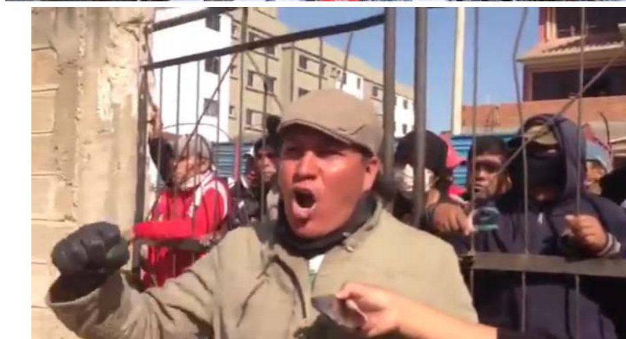
Obreros de Manaco de Quillacollo

Estos cabrones de los policías han entrado como maleantes, han destrozado nuestro sindicato. Han venido a destrozarnos nuestros inmuebles, nuestros coches, nosotros tenemos esto con nuestro sacrificio. Estamos en desacuerdo con este gobierno, esto se llama dictadura, tenemos que unirnos los bolivianos para sacarle al Evo Cabrón.